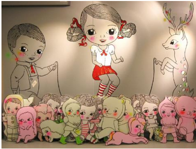
HUS Lastenkliniikan laajennusosan taidehankinta 2010 "Salainen Puutarha" / Katja Tukialainen