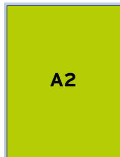
sisäkannet, sisäsivu 1/1